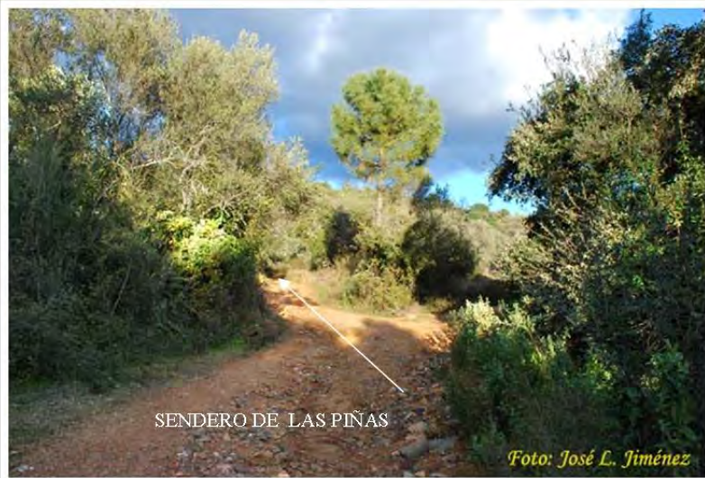
SENDERO DE LAS PIÑAS