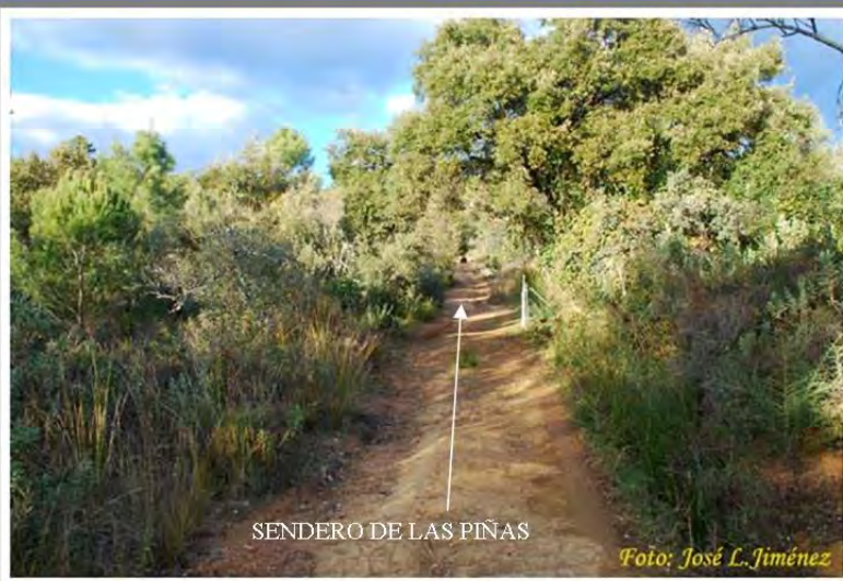
SENDERO DE LAS PIÑAS