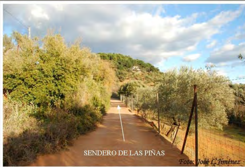
SENDERO DE LAS PIÑAS