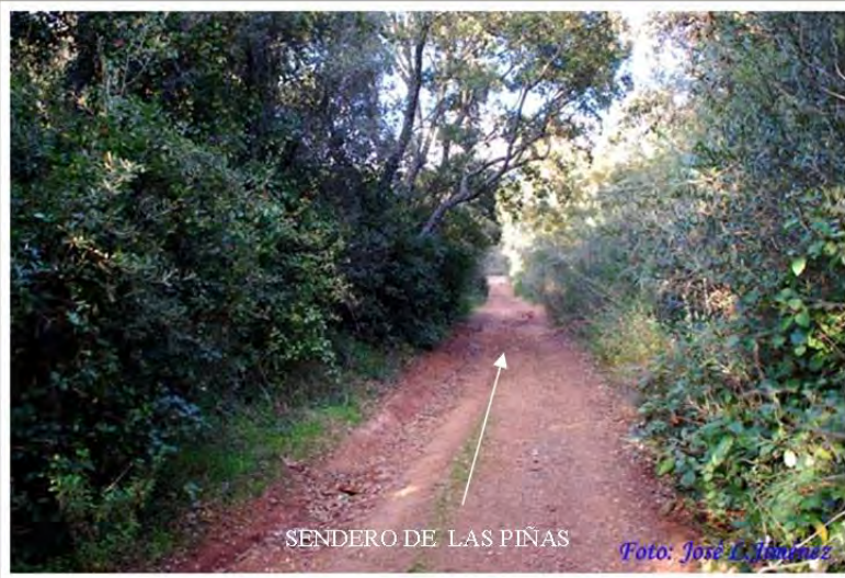
SENDERO DE LAS PIÑAS