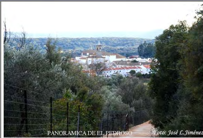
PANORAMICA DE EL PEDROSO