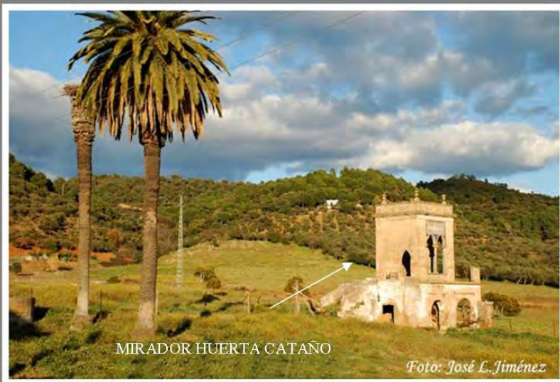
MIRADOR HUERTA CATAÑO